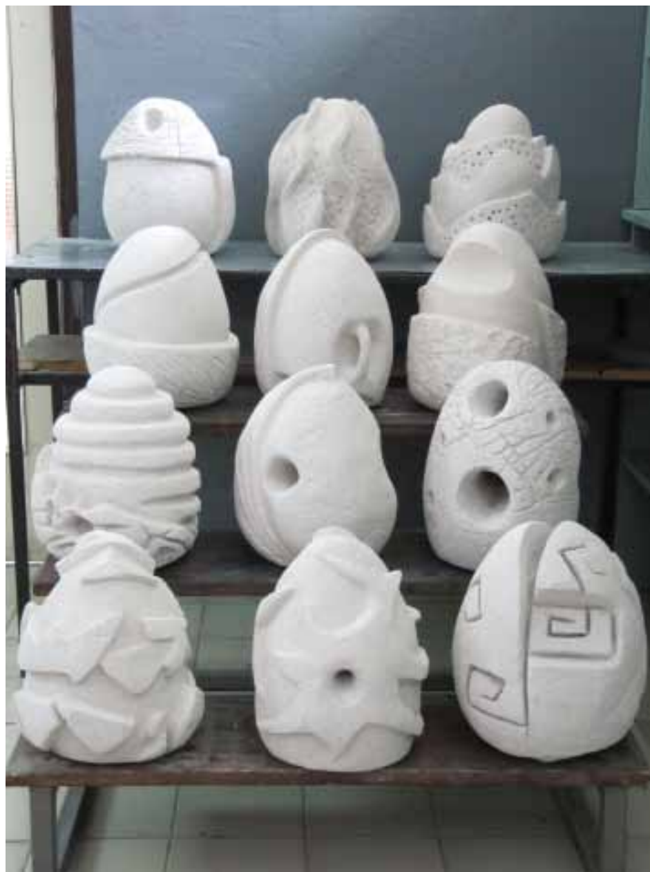
Pisanice, grupni rad - SŠ za umjetnost, dizajn, grafiku i odjeću Zabok